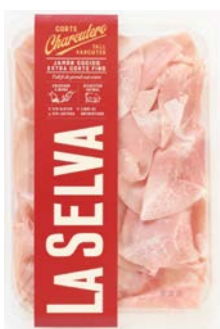
Pernil cuit extra LA SELVA tall xarcuter 90 g • 23,33 €/kg