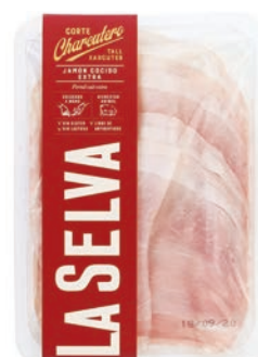
Pernil cuit tall xarcuter LA SELVA 100 g • 23,50 €/kg