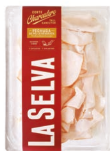
Pit d'indi o de pollastre brasejat LA SELVA tall xarcuter 90 g • 25,56 €/kg